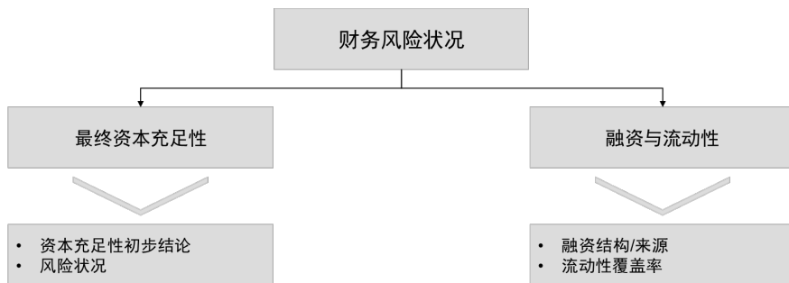
图 3 财务风险状况分析框架

财务风险状况反映了我们对多边开发性金融机构相较于其他同业在资本充足性、融资与流动性方面相对实力的观点（见图 3）。